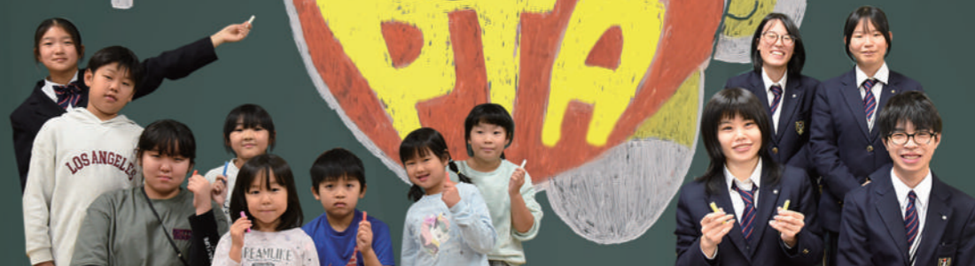
※表紙黒板アート制作 / 勝平小学校、大住小学校、上北手小学校、泉中学校の生徒さん 指導 / 秋田公立美術大学附属高等学院の生徒さん